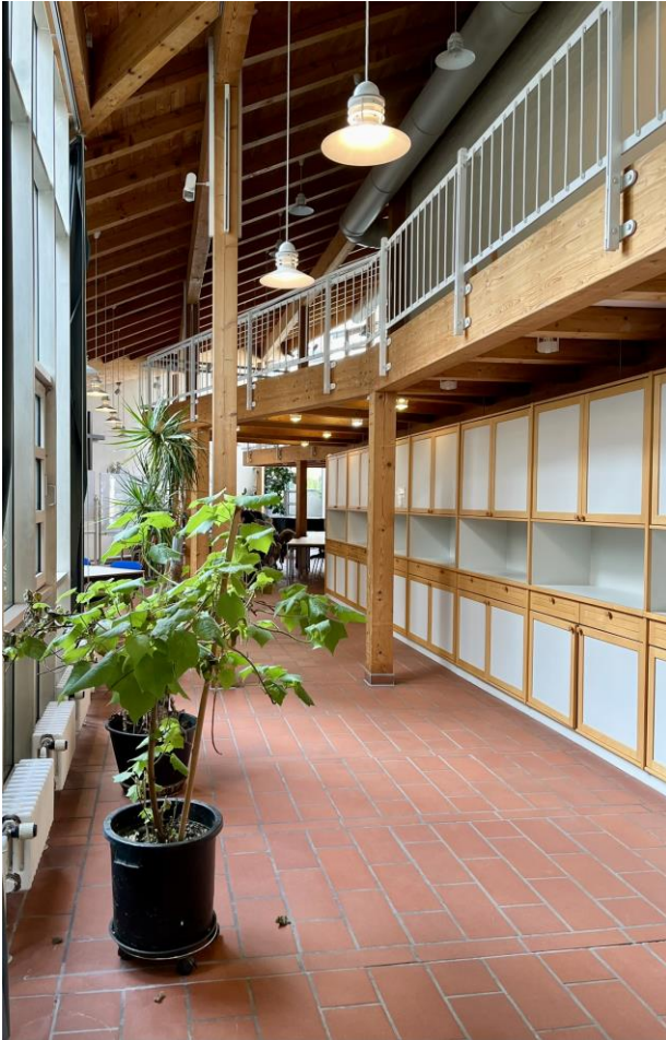
Aktuelle Aufnahmen des Gemeindesaals St. Johannes