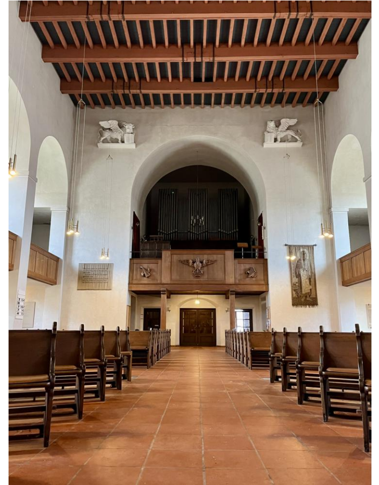
Aktuelle Aufnahmen St. Johanneskirche mit Innenraum und Blick auf die Steinmeyer-Orgel aus dem Jahr 1930