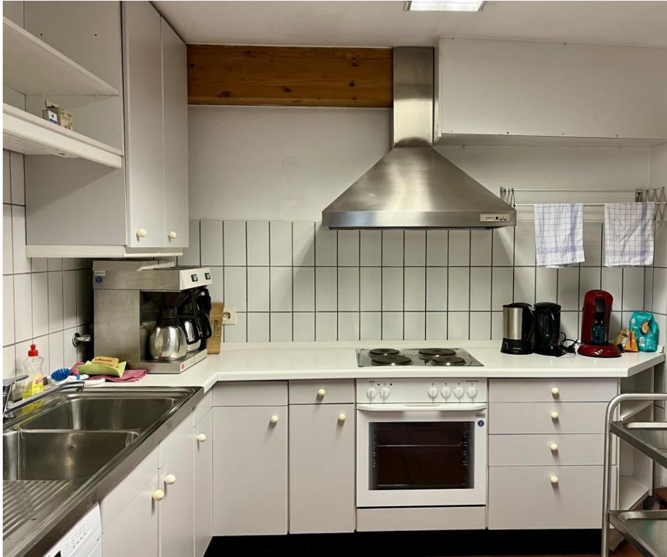
Ausstattung des Gemeindesaals mit Küche und barrierefreien Zugängen