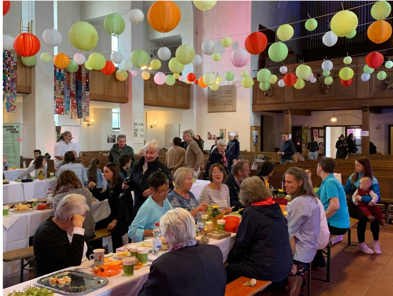
Aufnahmen der Friedenstafel in St. Johannes 2023