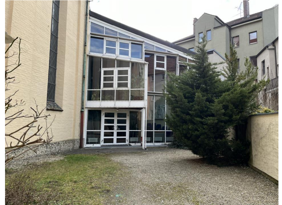
Umfriedete Außenanlage und Zugang zum Gemeindesaal