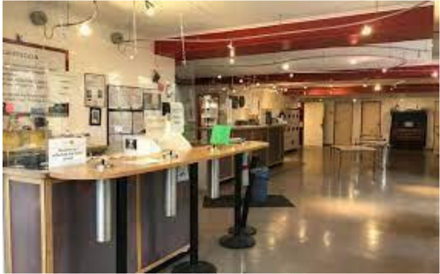
Bilder aus dem Angebot der Suchthilfe direkt gGmbH in Essen