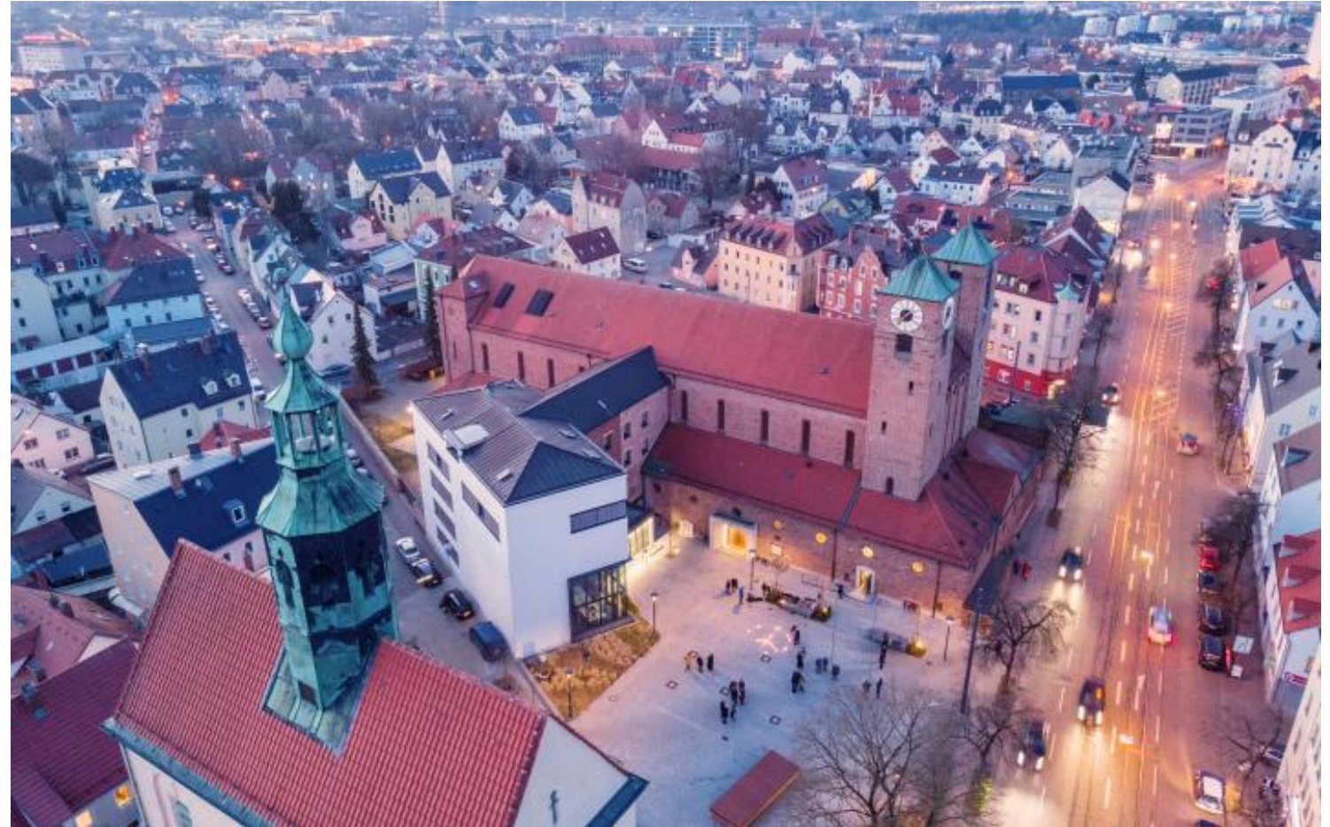
Aufnahmen Café am Milchberg (o.l.), Nachbarschaftsfest Oberhausen 2022 (u.l.), Luftaufnahme Friedensplatz (r.)