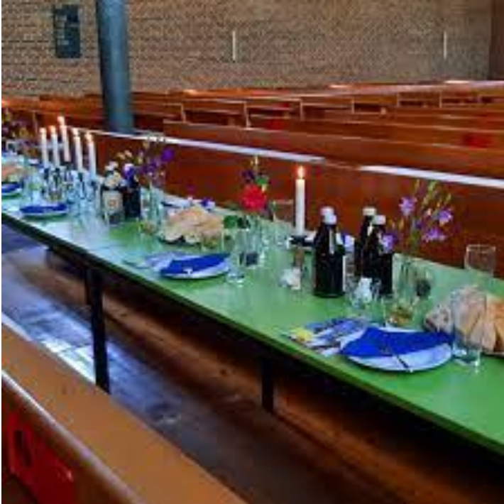
Aufnahme der Versperkirche St. Paul, Pfersee